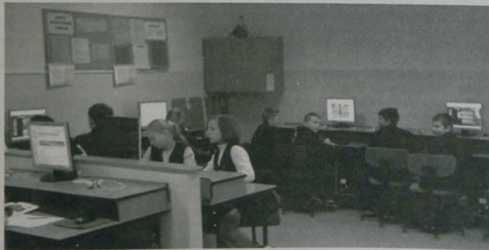
Nowa pracownia komputerowa.

W ramach projektu „Pracownie komputerowe dla szkół” w minionym roku szkolnym Szkoła Podstawowa im. Jana Pawła II w ZSP-G w Przeciszowie-Podlesiu otrzymała długo oczekiwaną, nową pracownię komputerową.