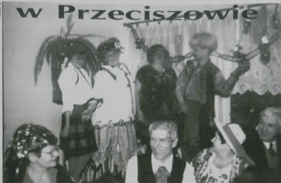
Podczas jednej z imprez.

Jednak na szczególną uwagę zasługują licznie organizowane przez Koło wycieczki. Jego członkowie odwiedzili: Wrocław z panoramą Raclawicką, Wiedeń, Dolinę Dunajca z trasą, prowadzącą przez zamki, Dębno, Melsztyn, Wiśnicz, Zawoję, Suchą Górę, Kocierz, Karniowice z kurhanem, Czernę Plażę, Wygiełzów. W tym roku odbyli wycieczki do Wisły, Szczyrku i Cieszyna, również po czeskiej stronie. Koło zaplanowało