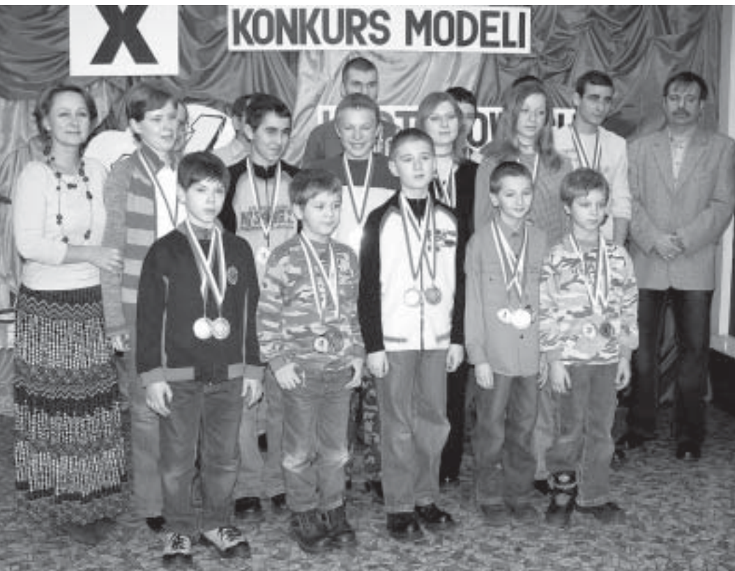
Podczas konkursu w Rybniku nasi modelarze osiągnęli znakomite wyniki i zanęśli się w gronie laureatów.