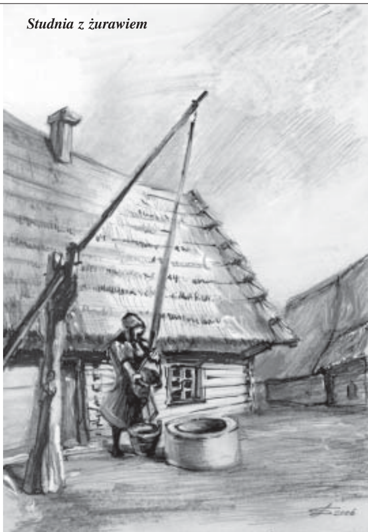
Studnia z żurawiem