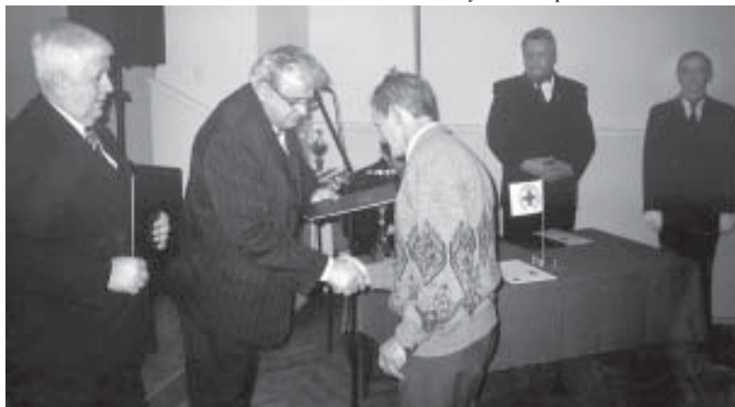
Obchodzono jubileusz HDK w Piotrowicach.