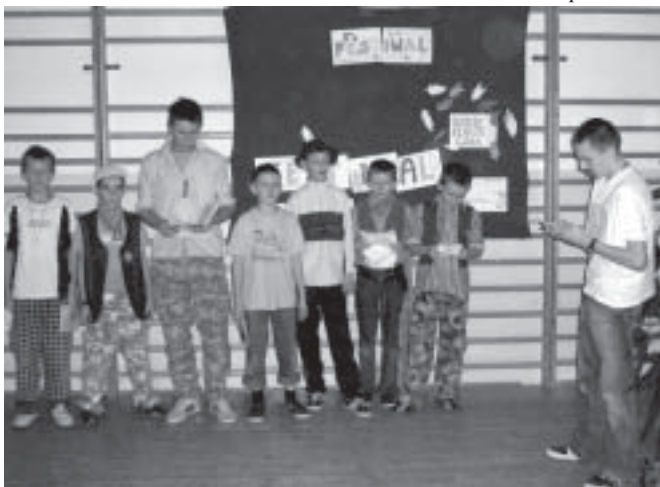
Biwak obfitował w wiele atrakcji.