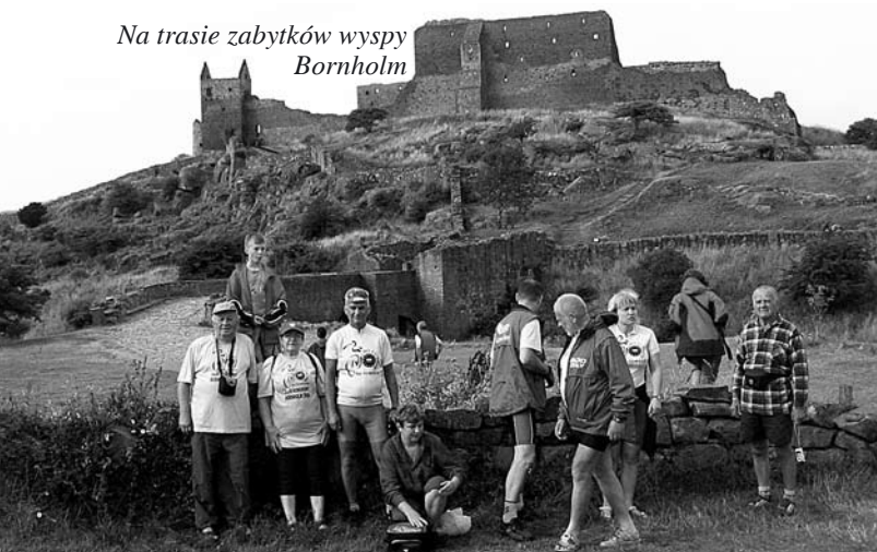
Na trasie zabytków wyspy Bornholm