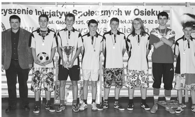
Triumfatorzy turnieju piłki halowej w Osieku.

Stowarzyszenie Inicjatyw Społecznych w Osieku