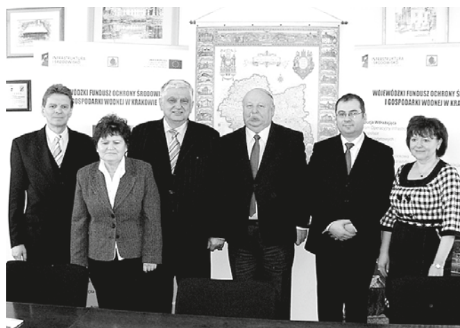
Przedstawiciele gmin, które otrzymały promesę na dofinansowanie budowy kanalizacji.

Przed nami do wykonania trzeci etap kanalizacji gminy Przeciszów. To ważne zadanie inwestycyjne obejmie ulice: Długą,