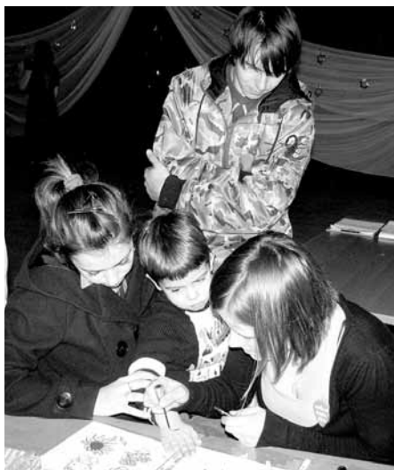
Jedna z atrakcji - malowanie....

10 stycznia po raz kolejny zagrała w gminie Przeciszów Wielka Orkiestra Świątecznej Pomocy. Środki zebrane w trakcie XVIII Finału zostaną przekazane na doposażenie klinik onkologicznych w sprzęt wysokospecjalistyczny. W tym roku sztab w Przeciszowie zebrał 9.711,90 zł, a w ubiegłym była to kwota 10.178,30 zł. Mimo niesprzyjających warunków pogodowych 20 wolontariuszy od samego rana kwestowało na terenie naszej gminy.