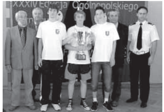
W finale wojewódzkim nasza drużyna zajęła III miejsce

Rywalizacja była bardzo zacięta między trzema najlepszymi drużynami Małopolski. Po podliczeniu okazało się, że na podium ponownie uplasowały się te same drużyny co w roku poprzednim, tylko w innej kolejności.