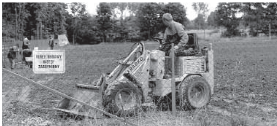
Trwa remont murawy boiska, które będzie gotowe na wiosnę 2012 roku.

Trwa remont murawy boiska LKS Przeciszovia. Zadanie, które polega na odnowieniu murawy boiska metodą hydroob-siewu, wykonuje firma Radko z Przeciszowa. Wartość inwestycji to 59.500 zł brutto. Firma zakończy swój zakres robót do końca czerwca 2011 r. Następnie murawa musi przejść okres pielęgnacji. Boisko wraz z murawą będzie gotowe na wiosenne rozgrywki w przyszłym roku. Przeciszovia na czas remontu gra na boisku w Zatorze.