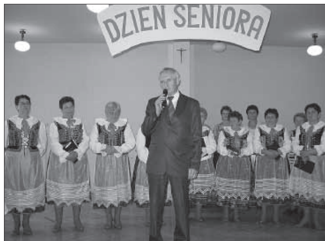
Wójt życzył seniorom długich lat życia.

Licznie przybyłym seniorom dziękujemy za przyjęcie zaproszenia i przybycie na spotkanie, które zakończyło się poczęstunkiem, na którym w miłej atmosferze wspomniano minione wydarzenia. □