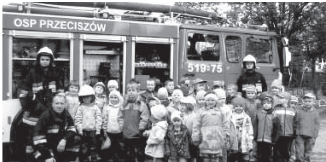
Przedszkolaki u strażaków

Następnie ubrane w kolor zielony powitały pierwszy dzień wiosny kolorowym marszem z balonami ulicami w pobliżu przedszkola. Zadowolone w wiosennym słońcu witały nową porę roku.