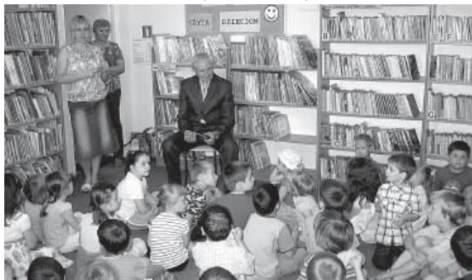
Wójt również czytał dzieciom

Serdecznie zapraszamy do ponownych odwiedzin.