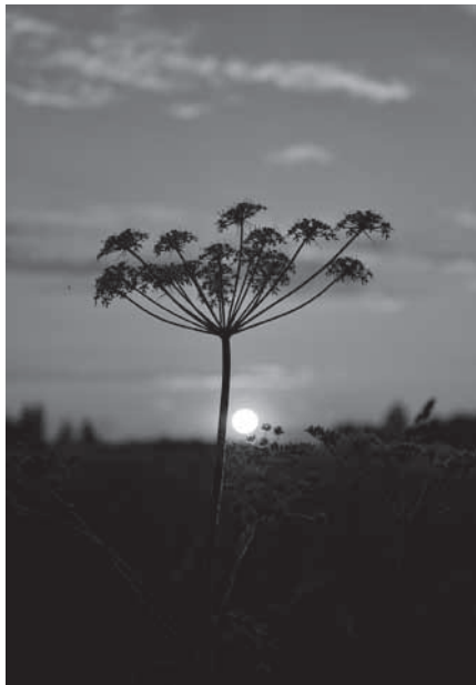
II miejsce – „Zachód słońca w Łączanach” autor Joanna Szymańska