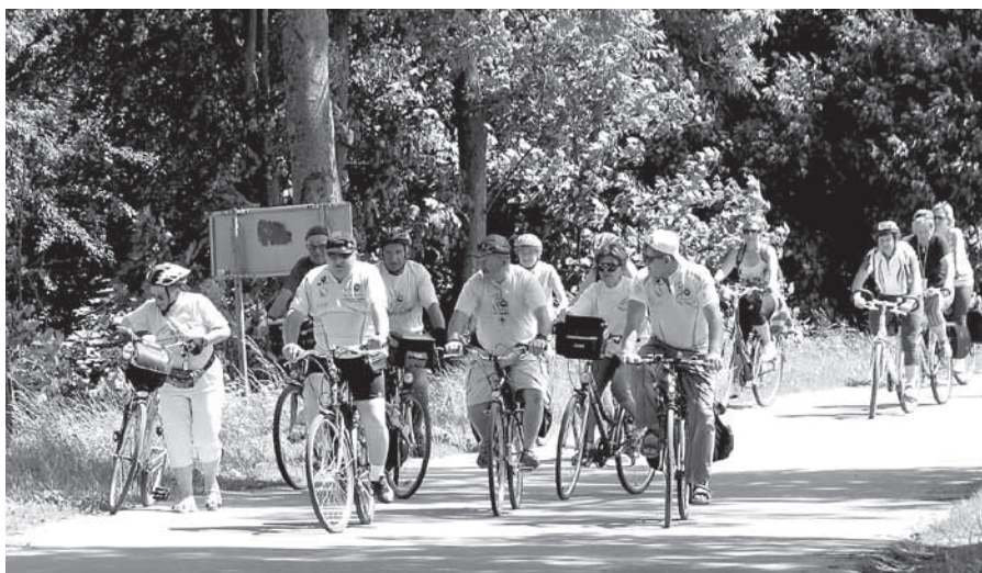
Cykliści w drodze do Wilczego Szańca w Gierłoży

- mazurska wieś Rapa, była celem kolejnej wycieczki rowerowej do miejsca,