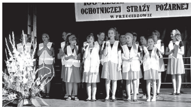
Uczestnicy konkursu podczas obchodów 100-lecia OSP