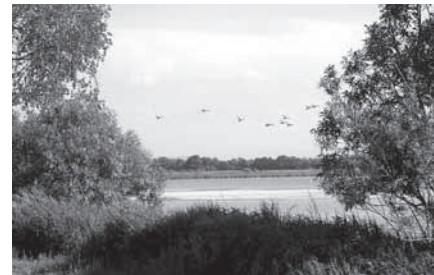
III miejsce – „Perspektywa” autor Roman Gancarczyk