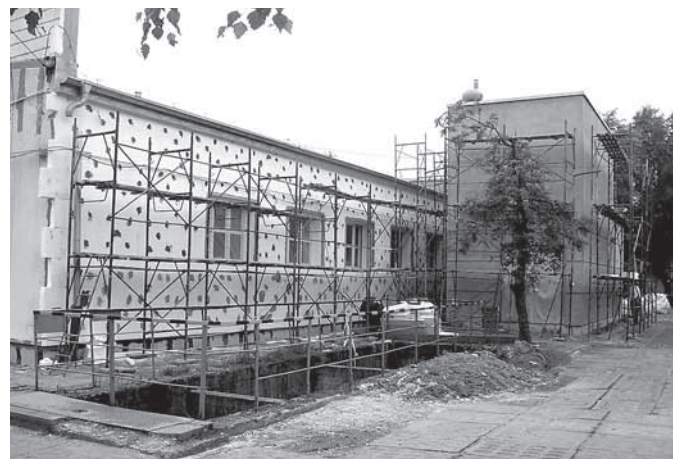
Remont stacji uzdatniania wody w Preciszowie