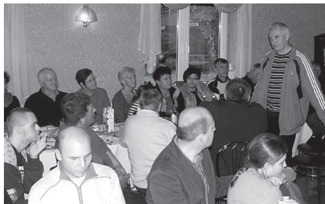
Spotkanie w Pubie „Torino” w Łowickach

Jak co roku wyjazd do leśniczówki w Brzeszczach Jawiszowicach na spotkanie wszystkich członków Towarzystwa Turystyki Rowerowej „Cyklista”, na którym krótko podsumowano sezon rowerowy, rozdano drobne suweniry dla aktywnych członków stowarzyszenia oraz skonsumowano pyszne „prażonki”