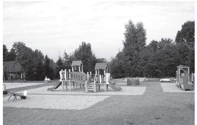
Nowoczesny i bezpieczny plac zabaw przy przedszkolu w Preciszowie