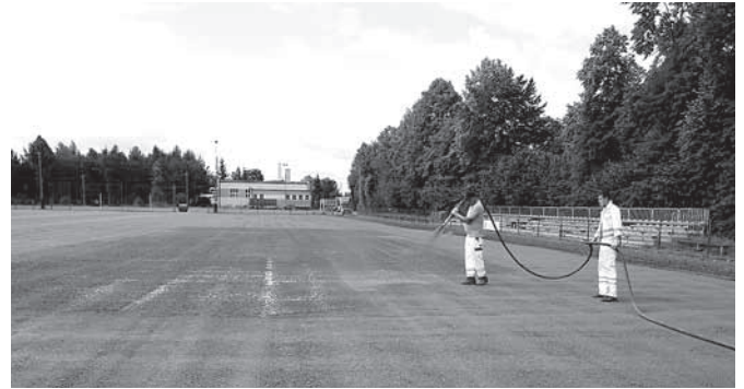
Prace związane z nawierzchnią boiska LKS Preciszowia