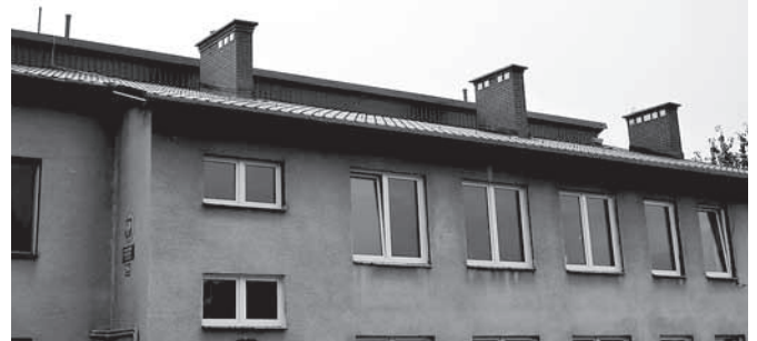
Wymienione pokrycie dachu na budynku przedszkola w Piotrowicach