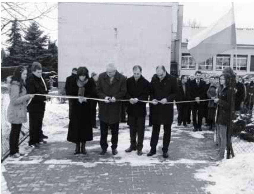
Moment przecięcia wstęgi symbolizował oficjalne otwarcie kompleksu boisk sportowych w Przeciszowie.