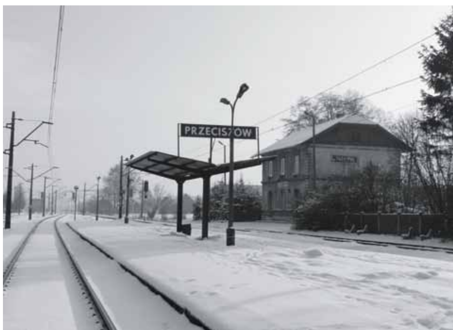
Jak tak dalej będzie z połączeniami kolejowymi, to nasza stacja popadnie w głębokie zapomnienie i ruinę.