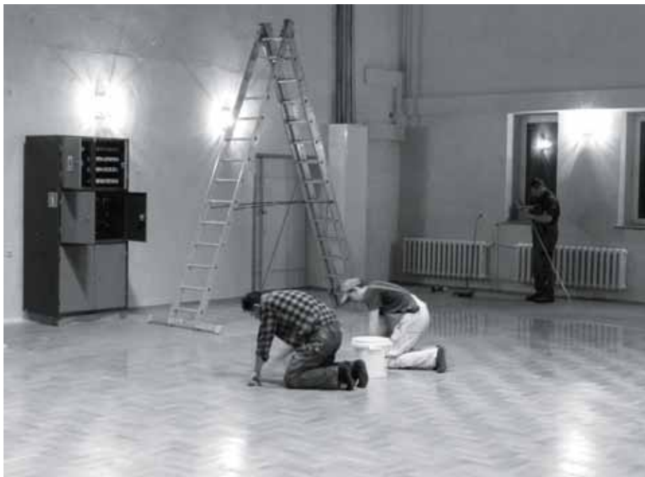
Podczas malowania sali widowiskowej w Domu Kultury w Przeciszowie.

Wykonano projekty na rozbudowę infrastruktury sportowej przy boisku piłkarskim LKS „Przeciszovia” w Przeciszowie, budowę obiektów sportowych przy ZSP-G