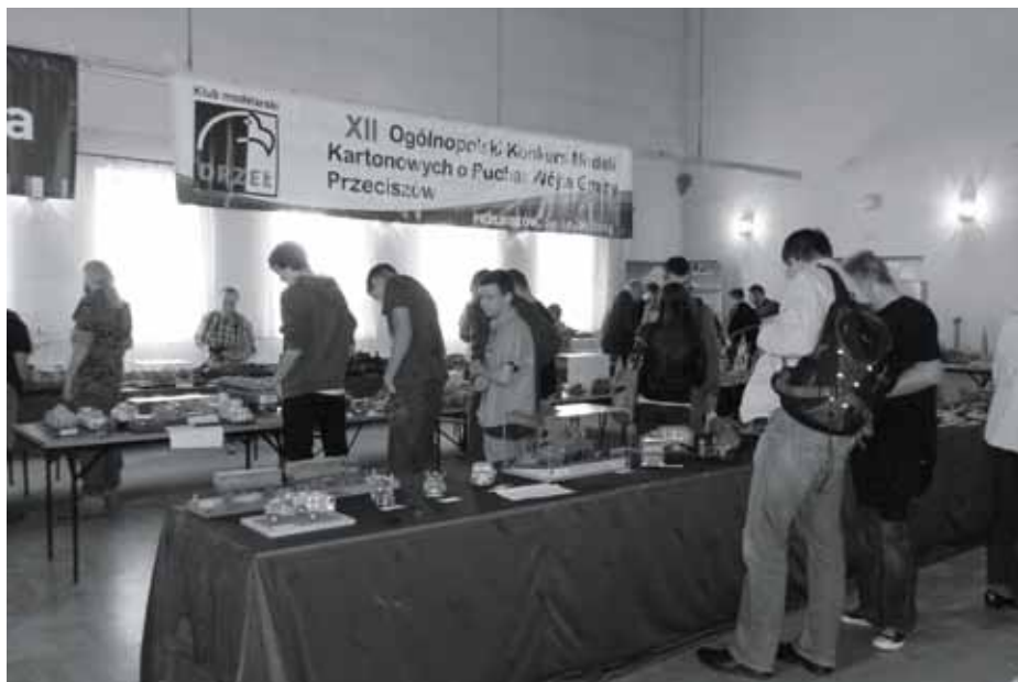
Konkurs cieszył się ogromnym zainteresowaniem, podobnie jak w innych latach. Informację o nagrodzonych osobach, z uwagi na objętość, podamy w kolejnym wydaniu WGP.