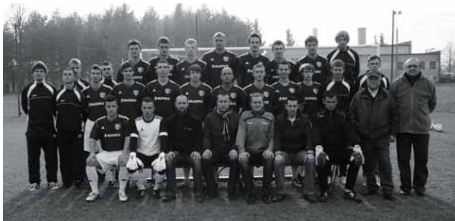
LKS Preciszovia.