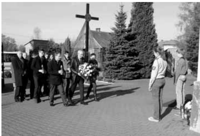
Tradycyjnie w Święto Niepodległości złożono kwiaty i zapalono znicze.

Elementem obchodów gminnych 11 Listopada było także otwarcie tras Nordic Walking oraz Marsz Niepodległości z kijami Nordic Walking. Jednak na ten temat piszemy szerzej w innym miejscu WGP. Zapraszamy do lektury. □