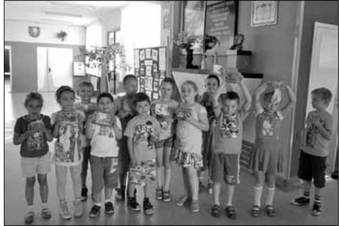
Pierwszaki prezentują zdrową żywność!

Dużo radości sprawiła najmłodszym uczniom akcja „Poranek śniadaniowżercy”. Z okazji Dnia Dziecka rodzice zaserwowali nam zdrowy poczęstunek jogurtowo – owocowy. Celem wywołania u uczniów apetytu na owoce, a odwrócenia uwagi od słodczy, sklepik szkolny otrzymał nową nazwę Wesołe Jabłuszko. Aby ułatwić uczniom odróżnienie dobrej żywności od niezdrowej, półki