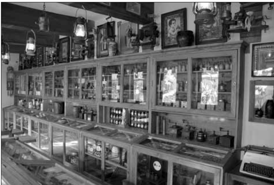
Kolekcjoner z Osieka zgromadził tysiące eksponatów. Dziś każdy może je obejrzeć.

jeden z nich chciał napisać list do władz w języku niemieckim, którego nie znał. Wówczas poprosił on sekretarza gminy, aby ten znający biegle niemiecki, wyręczył go w tym. Tak też się stało. W zamian za to sekretarz otrzymał wyjątkową, jedyną w swoim rodzaju popielnicę.