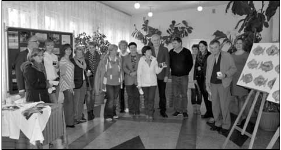
W trakcie spotkania uczestników konferencji w naszej gminie.

Podczas drugiego dnia konferencji uczestnicy wyjechali w teren Doliny Karpi,