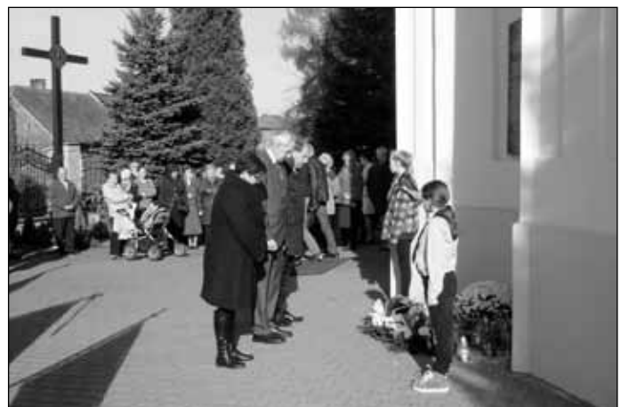
Moment złożenia kwiatów pod pamiątkową tablicą, umieszczoną na frontonie kościoła parafialnego w Przeciszowie.