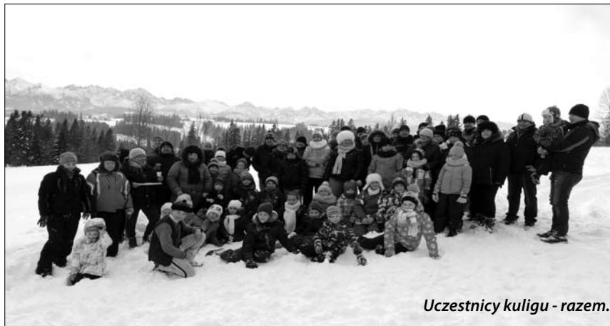
Uczestnicy kuligu - razem.