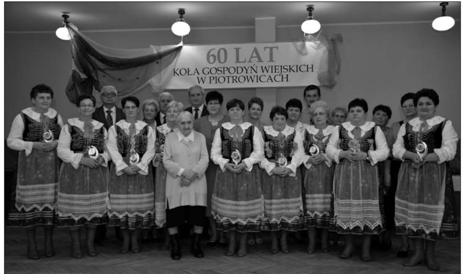
Panie z KGW w Piotrowicach obchodziły swój okrągły jubileusz!

W tym dniu Koło przedstawiło sprawozdanie ze swej działalności oraz wręczyło okolicznościowe statuetki przybyłym gościom i zasłużonym członkiniom KGW.