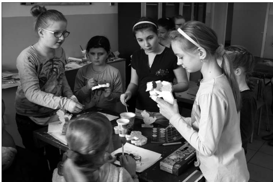
Podczas zajęć plastycznych.