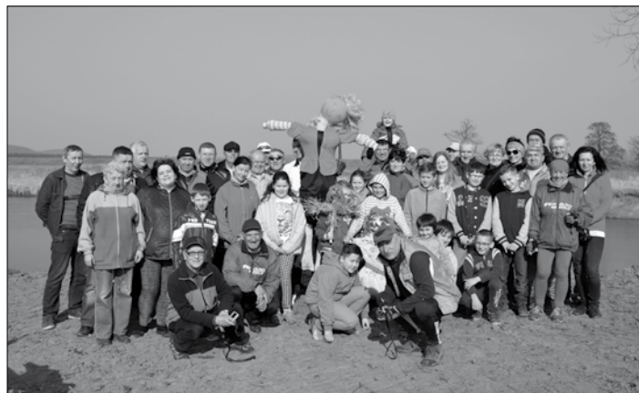
Już za chwilę Marzanna zostanie utopiona i zima odejdzie precz!