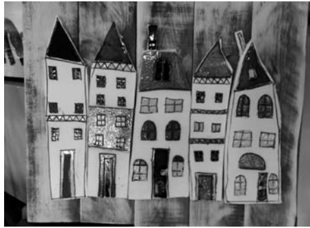
Jedna z prezentowanych prac.

Wystawa zbiegła się z obchodami 15-lecia istnienia WTZ w Chełmku i z tej okazji zaprezentowano spektakl pt. „Brat Naszego