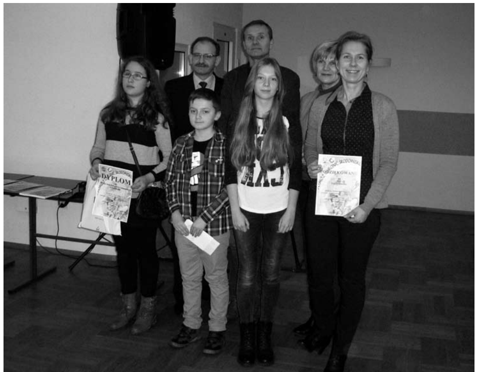
Uczniowie ze szkoły w Przeciszowie zebrali najwięcej zużytych baterii! Na zdjęciu zwycięzcy konkursu, nauczyciele oraz starosta oświęcimski Zbigniew Starzec.

- Ilość zebranych baterii przerosła nasze oczekiwania. W roku 2014 zebraliśmy ponad 5 ton baterii – to o 40 procent więcej w stosunku do roku poprzedniego. Cieszy fakt, że temat ekologii budzi zainteresowanie wśród uczniów szkół. Mamy nadzieję, że młodzi ludzie w sposób bardziej wyedukowany będą postrzegać otaczające je środowisko – zaznaczył Witold Augustyn, prezes Zakładu Usług Komunalnych w Oświęcimiu.