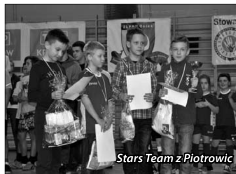
Stars Team z Piotrowic