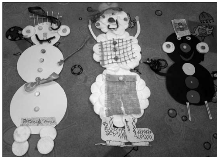
Te prace plastyczne były efektem warsztatów.

W ferie zimowe nie mogli zabraknąć seansów filmowych, dlatego