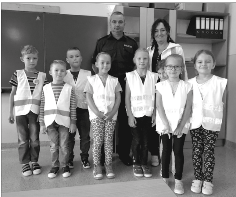
Pierwszaki w kamizelkach odblaskowych z policjantem i wychowawczynią.

Uczniowie z klasy pierwszej Szkoły Podstawowej w Przeciszowie przystąpili do konkursu Odblaskowa Szkoła. Akcja ta, w której nasza szkoła z powodzeniem bierze udział już siódmy raz, ma na celu pomóc dzieciom poznać zasady bezpieczeństwa w ruchu drogowym, a przede wszystkim pokazać jak ważne jest noszenie odblasków i bycie widocznym na drodze.