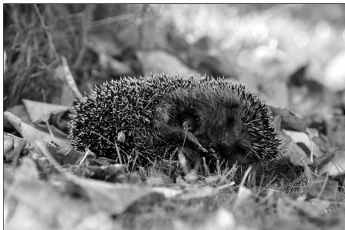
III miejsce, autor Agnieszka Wielińska.