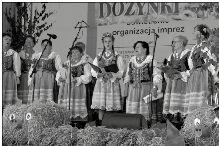
Występ zespołu Same Swoje z Przeciszowa.

Tegoroczne dożynki zakończyła zabawa taneczna, do której przygrywał zespół Active.