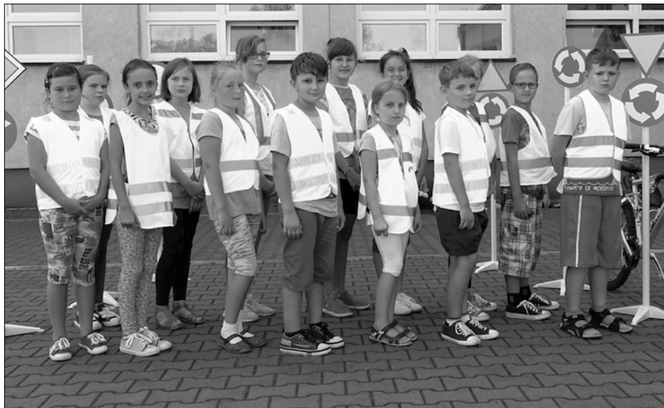
Uczniowie biorą udział w konkursie Odblaskowa Szkoła. Będzie bezpieczniej na drodze!

Wymienione działania promują najbardziej aktywne szkoły oraz społeczności lokal-