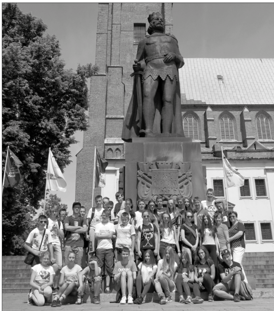
Gimnazjaliści wraz z nauczycielami pozują u stóp pomnika króla Bolesława Chrobrego.

Ostatni dzień to wspinaczka na Mysią Wieżę w Kruszwicy, do której zachęcał nas Piast Kołodziej i Popiel. Stamtąd podziwialiśmy nadgoplański krajobraz, a po zejściu z wieży romańską kolegiatę, która zachowała swój