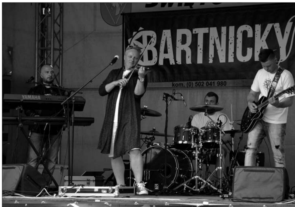
W pierwszym dniu Święta Gminy Przeciszów wystąpił zespół Bartnicki, którego lider zagrał na skrzypcach. Było głośno, bardzo muzycznie i energicznie.