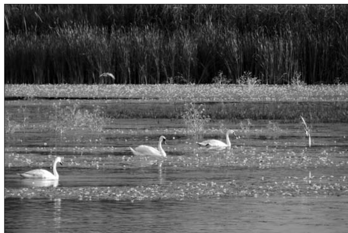
II miejsce, autor Krystyna Michałek.