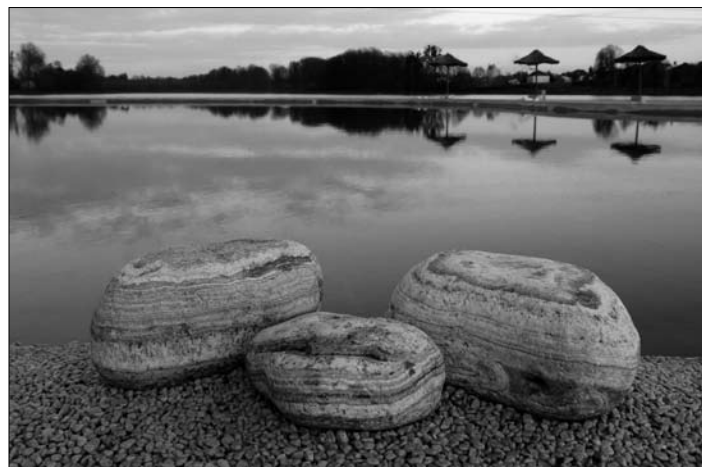
Wyróżnienie, autor Paweł Michałek.