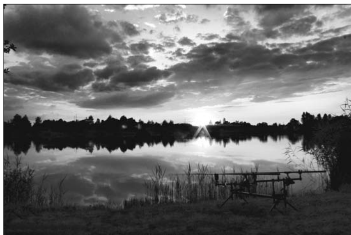
I miejsce, autor Krystyna Kościelnik.