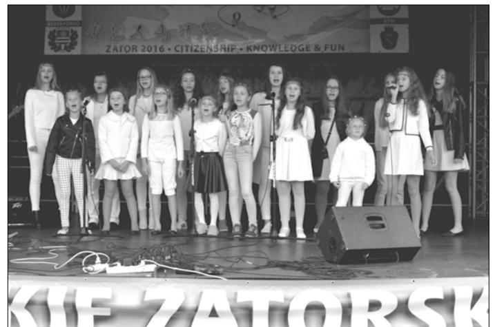
Występ chóru Perfectum z Piotrowic.

18 września na Łowiskach Wędkarskich Podolsze koło Zatora odbyły się Wielkie Żniwa Karpiove, które były oficjalnym zakończeniem cyklu imprez i wydarzeń na terenie Doliny Karpi.