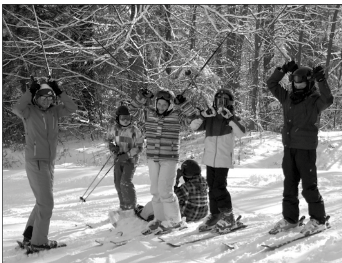
Uczyli się jeździć na nartach.

Od 11 do 15 stycznia 17. uczniów z klasy V Szkoły Podstawowej w Przeciszowie przebywało na Białej Szkole w ośrodku Ostoja Górską w Koninkach (gmina Niedźwiedź) w Gorczańskim Parku Narodowym. Celem wyjazdu była nauka jazdy na nartach - dla początkujących) i doskonalenie techniki jazdy - dla bardziej doświadczonych narciarzy).