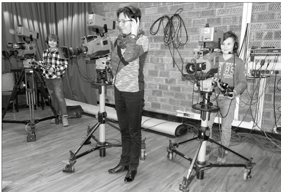
Pierwszy raz za prawdziwą kamerą w prawdziwym studio!

W kolejnych interesujących miejscach poznajemy tajemnice i różne sztuczki telewizyjne. Z ogromnym niedowierzaniem patrzyliśmy na greenbox, zielony ekran. To na jego tle nagrywane są czasem programy telewizyjne, by później osadzić aktorów czy też dziennikarzy w dowolnej scenarii.