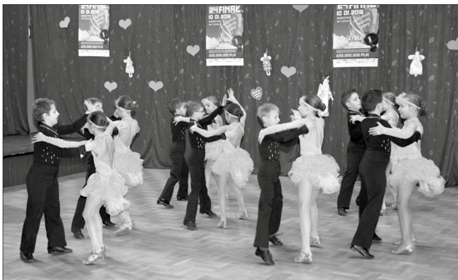
Popis najmłodszej grupy tanecznej budził aplauz publiczności.