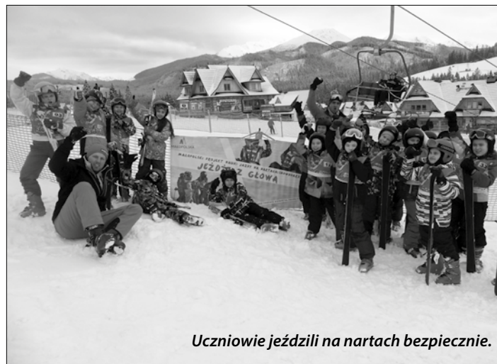
Uczniowie jeździli na nartach bezpiecznie.

Enota jest zdrowym stanem duszy, jej pięknem i siłą, natomiast małoduszność jest jej plagą, brzydotą i chorobą.