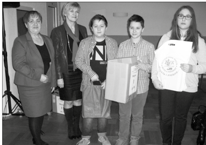
Reprezentanci naszej szkoły odebrali nagrody z rąk wiceprezydent Oświęcimia (pierwsza od lewej).

jedna mała bateria powoduje degradację 1 m 3 gleby? Baterie zawierają m.in. ołów, kadm, rtęć, które nie ulegają neutralizacji.