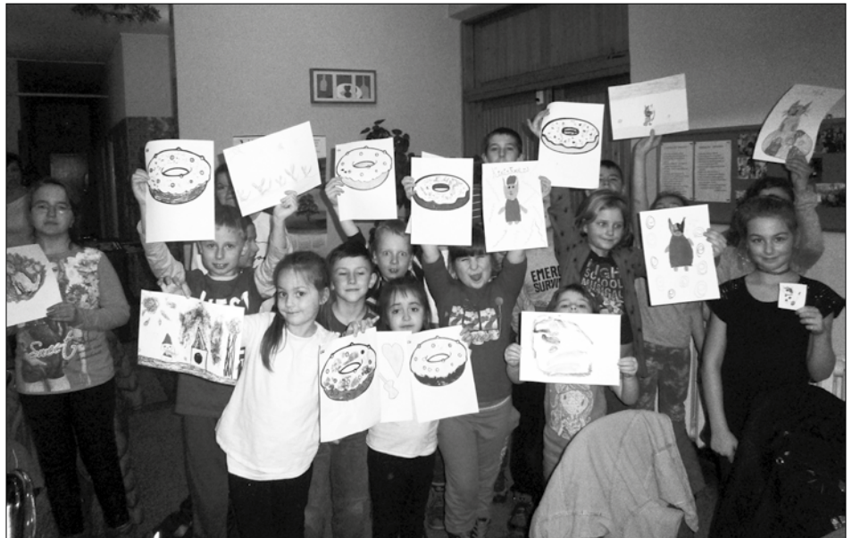
Ośrodek oferuje wiele interesujących zajęć.

1 marca miały miejsce pokazowe zajęcia edukacyjne pod hasłem „Pierwsza pomoc przedmedyczna”. Prelekacja oraz pokaz zorganizowano w celu podniesienia poziomu wiedzy i umiejętności w zakresie udzielania pierwszej pomocy w razie wypadku, urazu lub nagłego ataku choroby, ochrony życia