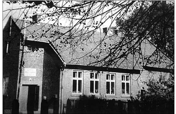
Tak wyglądała szkoła wybudowana w roku 1936.

Nauka rozpoczęła się w nowym budynku szkolnym. W roku tym było w planie wykończyć mieszkanie dla kierownika szkoły. Dzieci, które pierwsze rozpoczęły naukę w nowej szkole: