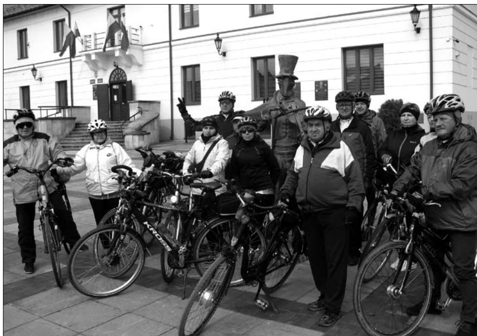
Cykliści zatrzymali się podczas zwiedzania Szczepreszyna i zapozowali do zdjęcia .

szych podjazdów. 90 proc. trasy to była jazda po równym terenie lub zjazdy w dół. W ciągu trzech dni dwa razy przejeżdżaliśmy granice ze Słowacją.