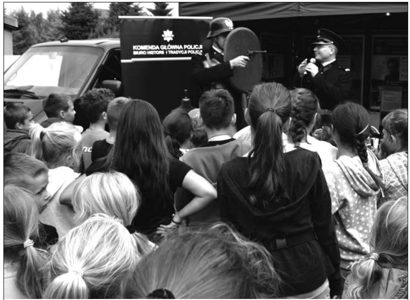
Dużym zainteresowaniem cieszyły się wśród dzieci pokazy grupy historycznej.

Czasy minione przybliżyła również Grupa Rekonstrukcji Historycznej. Jej członkowie przebrani w mundury przedwojennej policji chętnie dzielili się swoją wiedzą dotyczącą pierwszych lat funkcjonowania tej formacji na terytorium II RP.