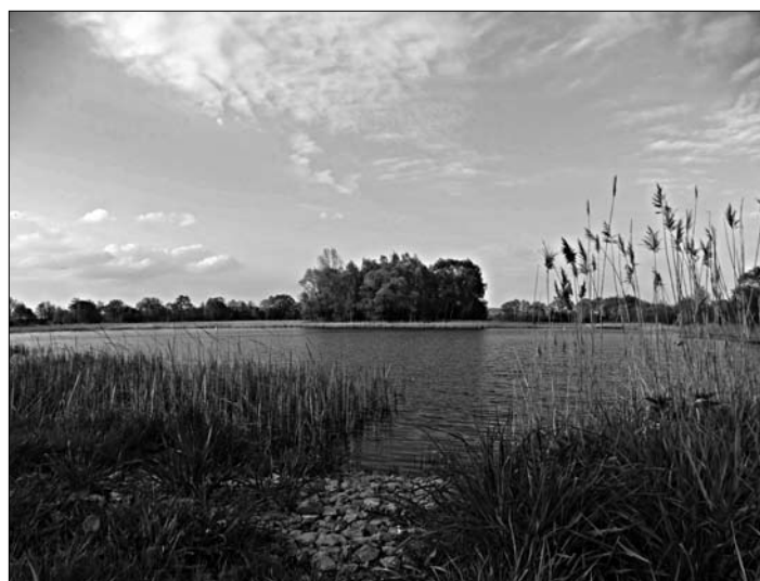
III miejsce – Krystyna Michałek „Staw”