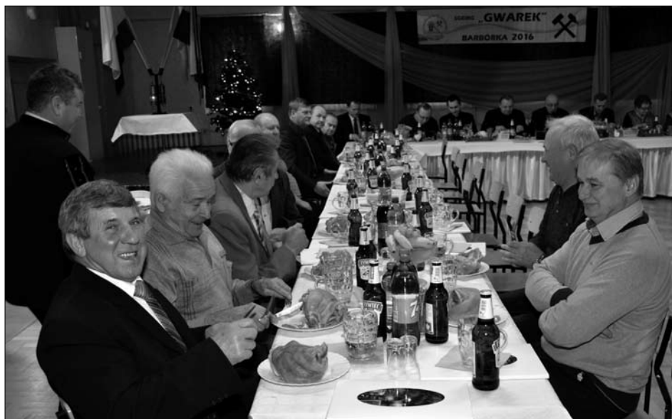
Golonka podczas biesiady cieszyła się sporym zainteresowaniem!

Stowarzyszenie Górników, Emerytów i Rencistów Górniczych Gwarek po raz czwarty zorganizowało spotkanie barbórkowe w Przeciszowie. Uroczystości rozpoczęły się mszą świętą, a następnie przeniosły się do Domu Kultury w Przeciszowie.