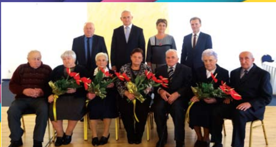
Pary obchodzące Żelazne i Diamentowe Gody