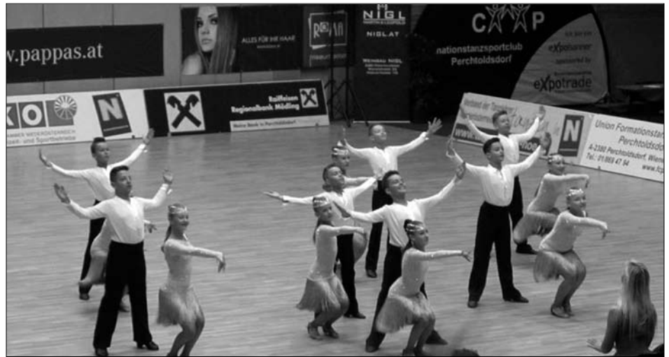
Zespół Dingo podczas występu!

Redakcja WGP gratuluje i życzymy dalszych sukcesów!