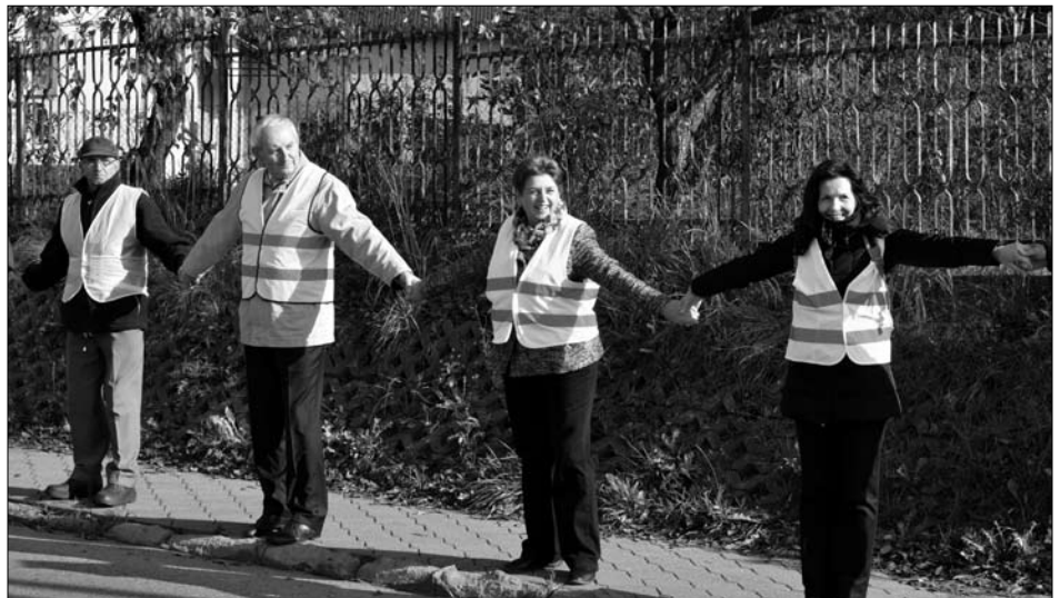
To była prawdziwa wspólnota połączonych w odblasku. Teraz już każdy wie jak poruszać się po jezdni!

Dziękujemy wszystkim, którzy w ten piąt-