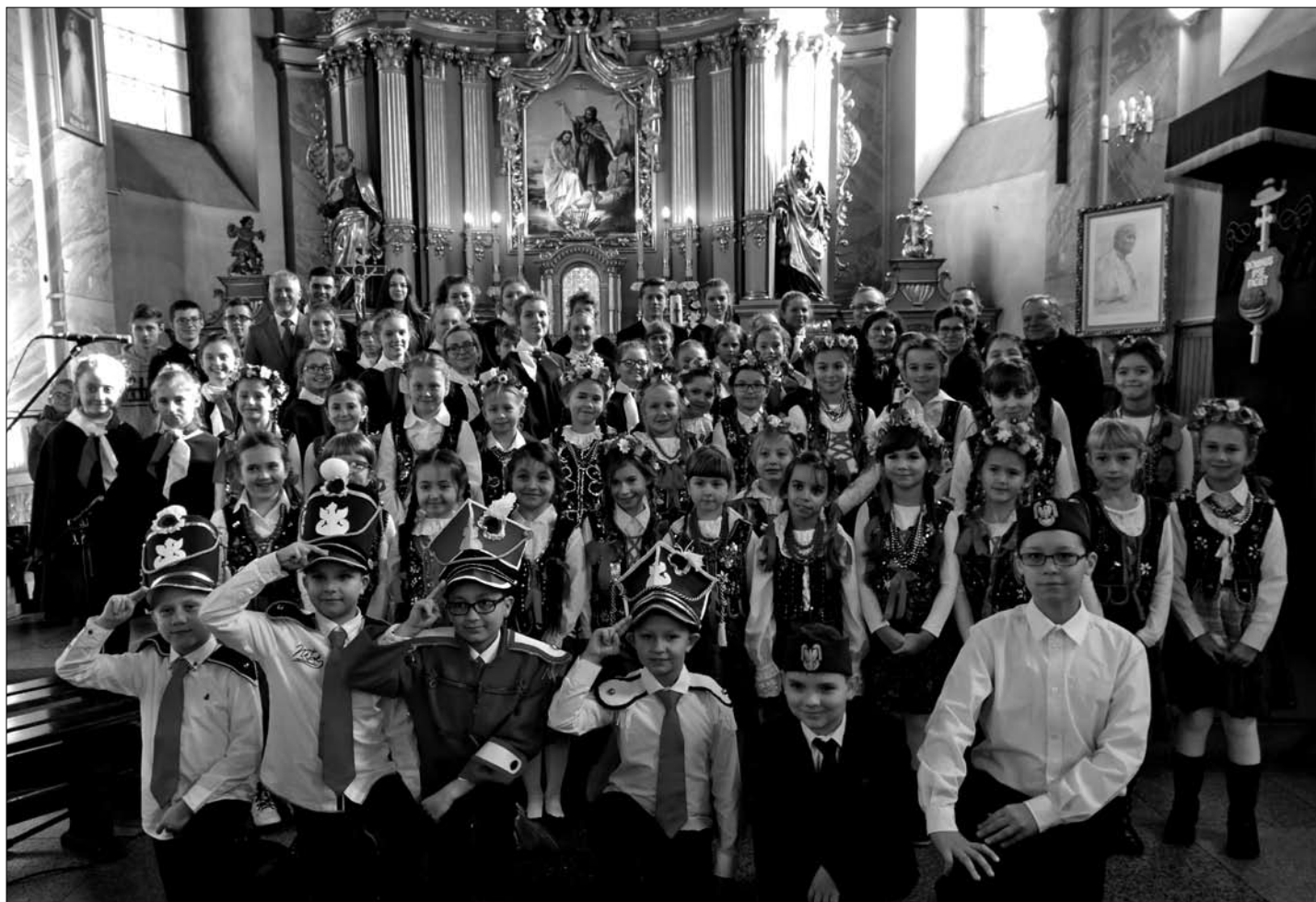
Śpiewające Jeziora po koncercie patriotycznym.

Pieśni patriotyczne są w repertuarze Śpiewających Jezior od chwili powstania zespołu. Podczas obchodów świąt państwowych uczniowie wykonują między innymi Mazurka Dąbrowskiego.