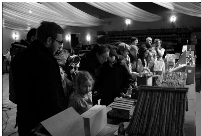
Zainteresowanie w tym roku konkursem było duże, tak jak w latach ubiegłych!