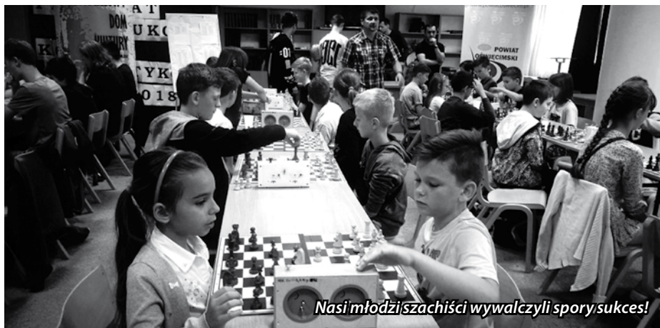
Nasi młodzi szachiści wywalczyli spory sukces!