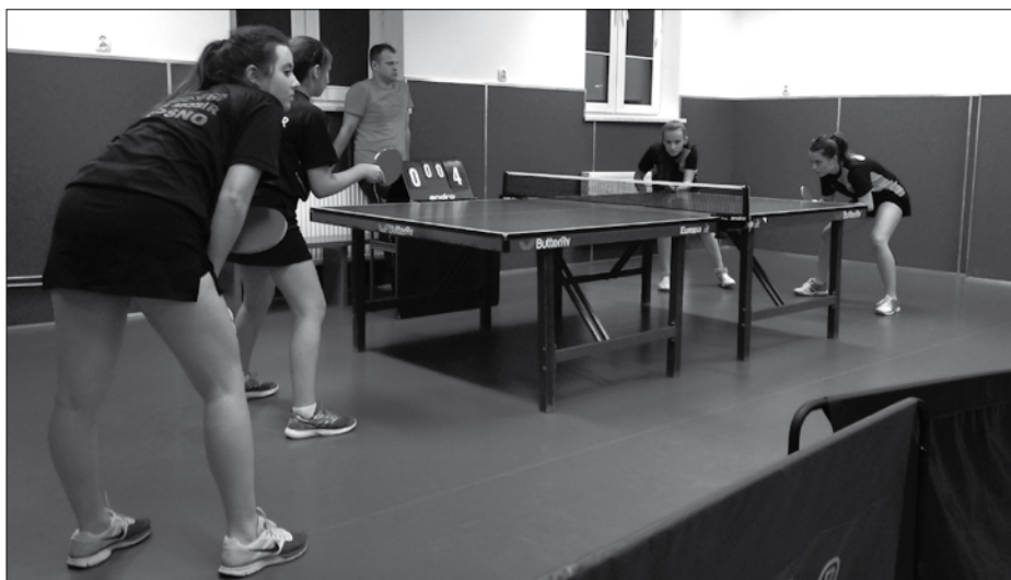
Mecze tenisa stołowego naszych zawodniczek w Krośnie były trudne i stresujące.

Aktualnie tenisiści LKS Piotrowice znajdują się na 6 pozycji w stawce 12 zespołów. Jak dotąd zanotowaliśmy dwa zwycięstwa,