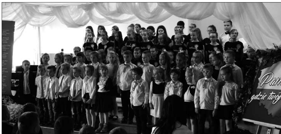
Dzieci były zaangażowane i skupione podczas koncertu jubileuszowego.