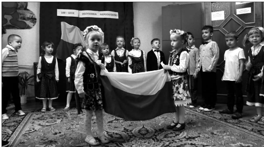
Tak obchodzono Święto Narodowe w przedszkolu.

Trzeba przyznać, że przedszkolaki wystąpiły wspaniale, a biało-czerwone stroje podkreślały patriotyczny charakter impre-