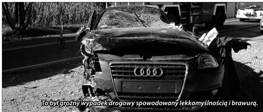
To był groźny wypadek drogowy spowodowany lekkomyślnością i brawurą.

W wyniku wypadku poważnych obrażeń ciała doznał kierowca audi, który był reanimowany, a następnie w stanie ciężkim, przetransportowany helikopterem medycznym do jednego ze śląskich szpitali.