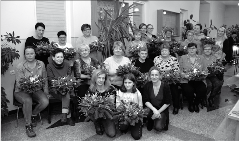
Uczestniczki warsztatów florystycznych wykonywały stroiki bożonarodzeniowe.

W związku ze zbliżającymi się Świętami Bożego Narodzenia biblioteka w Preciszowie zorganizowała warsztaty florystyczne pn. „Stroik bożonarodzeniowy”.