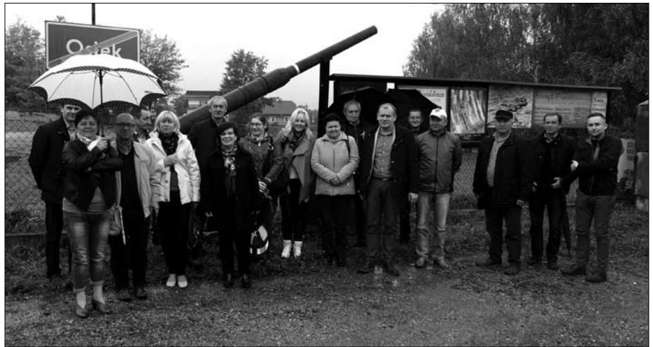
Podczas wizyty studyjnej samorządowców w Dolinie Karpia. Zdjęcie wykonano w Osieku.