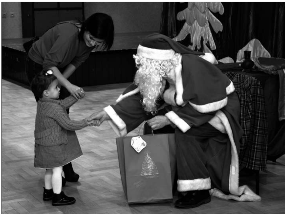
Mikołaj zawsze budził u dzieci emocje. W tym roku nie mogło być inaczej.

Mikołajki to czas bardzo wyczekiwany przez najmłodszych przez cały rok. To okazja do sprawiania wszelkiego rodzaju niespodzianek i obdarowywania bliskich drobnymi prezentami w tajemnicy.