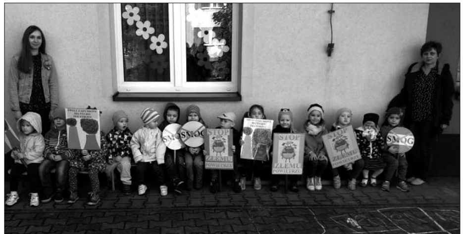
Przedzkolaki już wiedzą jak ważna jest ekologia i czyste powietrze.

Po części oficjalnej, najstarsza grupa Sówki udała się do sali przedszkolnej, gdzie wzięła udział w zajęciach dotyczących smogu. Na rozpoczęcie, przedszkolaki uczestniczyły w rozmowie na temat tego, co to jest powietrze oraz dowiedziały się, czym jest dym i jakie są jego źródła.