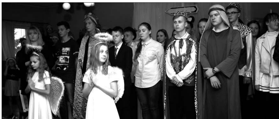
Ten występ o klimacie bożonarodzeniowych jasełek był inny i skłaniał do zadumy.