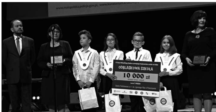
Sukces i najwyższe trofeum szkoły w tym konkursie staje się już tradycją! Gratulujemy!